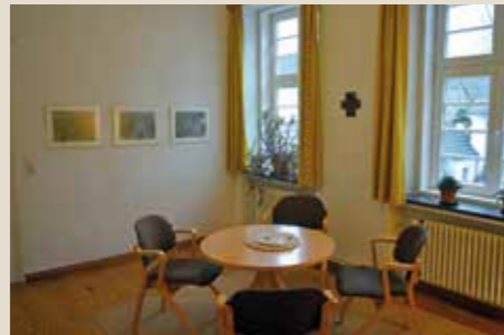
Hl. Adelheid v. Vilich: bis 6 Personen, 18 qm