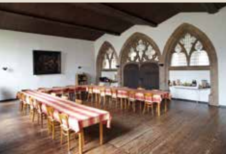
Kapitelsaal: bis 60 Personen, 120 qm