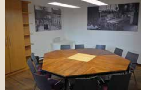
Seminarraum 3: bis 12 Personen, 36 qm