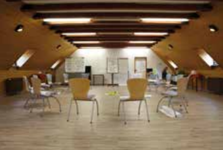
Dachsaal: bis 50 Personen, 130 qm