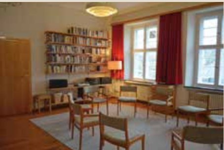
Hl. Edith: bis 12 Personen, 37 qm