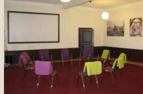
Seminarraum 2: bis 60 Personen, 110 qm