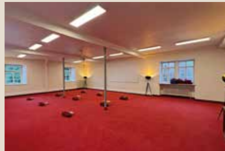
Musikraum: bis 70 Personen, 150 qm