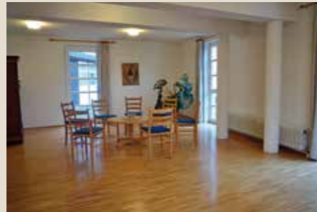
Hl. Scholastika: bis 15 Personen, 37 qm