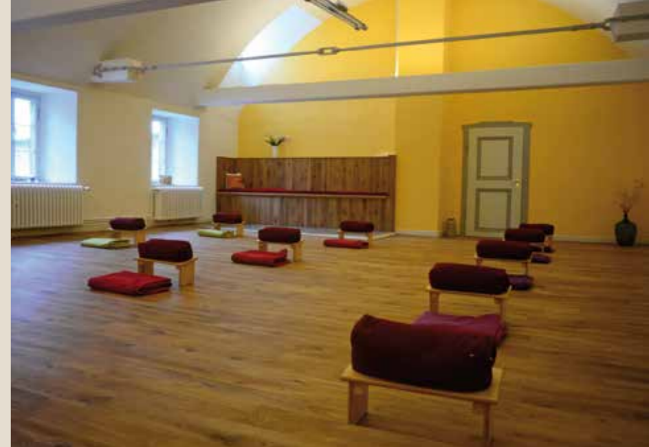
Pater-Pankratius-Raum: bis 50 Pers., 110 qm