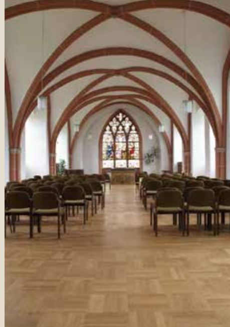
Alte Bibliothek: bis 150 Personen, 230 qm