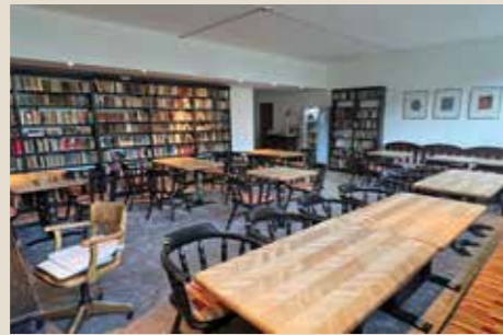
Aufenthaltsraum: bis 40 Personen, 70 qm