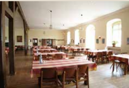
Hermann-Josef-Saal: bis 100 Pers., 220 qm