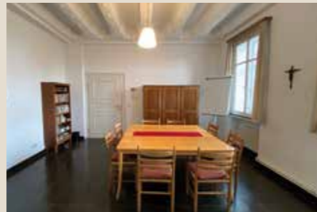
Hl. Walburga: bis 12 Personen, 23 qm

Unsere Tagungs- und Seminarräume verteilen sich über die gesamte Klosteranlage. Daher sollten Sie sich für eine persönliche Besichtigung etwas Zeit nehmen und bitte un-