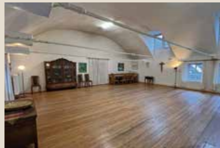
Akademieraum: bis 40 Personen, 120 qm