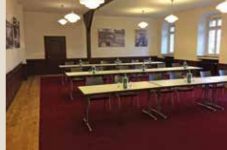
Seminarraum 1: bis 50 Personen, 100 qm