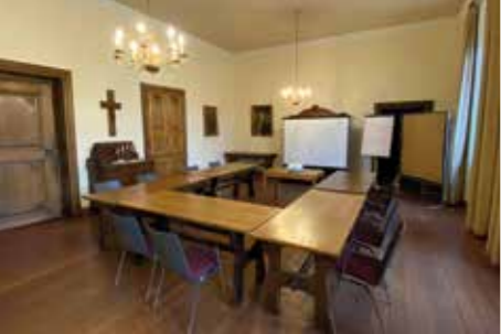
Pater-Jordan-Raum: bis 25 Personen, 60 qm