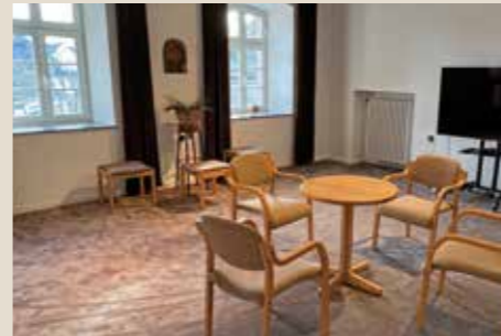
Seminarraum 5: bis 12 Personen, 30 qm