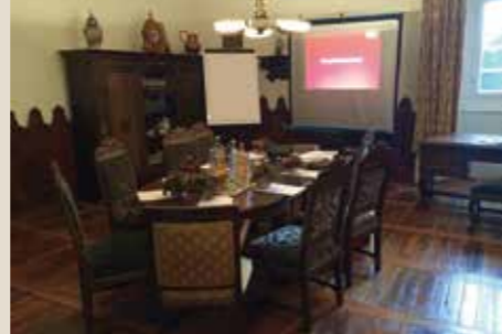
Löwenzimmer: bis 8 Personen, 36 qm