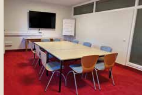
Seminarraum 4: bis 10 Personen, 24 qm