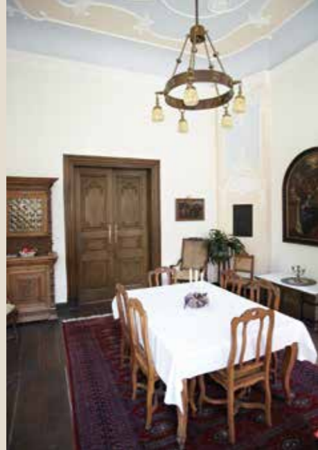
Sprechzimmer Prälatur: bis 10 Personen, 36 qm