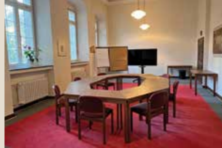
Vor der Hauskapelle: bis 20 Personen, 66 qm