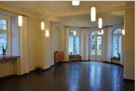
Refektorium St. Benedikt: bis 20 Pers., 42 qm